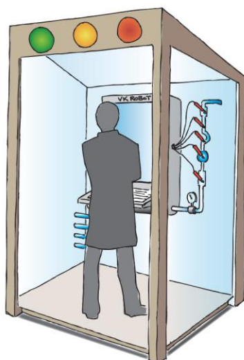
Figur 2. Vannkvalitetsrobot montert innomhus. Målekammeret til høyre på bildet kan tilpasses hver enkelt sondetype